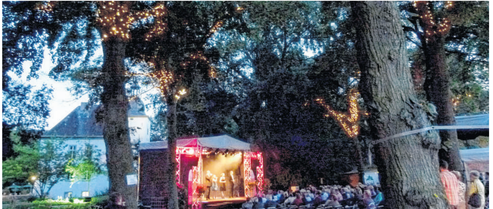
Das Ambiente stimmt, wie dieses Foto aus dem Vorjahr zeigt.

Homburg. Besonders aggressiv reagiert ein 32-Jähriger vergangenen Mittwoch, auf den Versuch von Polizisten, kurz vor 20 Uhr auf der Eifelstraße in Homburg einen Streit unter Nachbarn zu schlichten. Erst beleidigte der Mann die Beamten, dann versuchte er dem ganzen Nachdruck zu verleihen, indem er nach den Polizisten trat. Mit einfacher körperlicher Gewalt brachten die Gesetzeshüter den Randalierer in den Streifenwagen und anschließend in das Polizeigewahrsam. Später konnte der Streitsüchtige wieder nach Hause. Für den Fall, dass die hohen Temperaturen zum Ausrasten des Duisburgers geführt haben, könnte das eingeleitete Strafverfahren wegen Widerstandes gegen Vollstreckungsbeamte für eine Abkühlung sorgen.